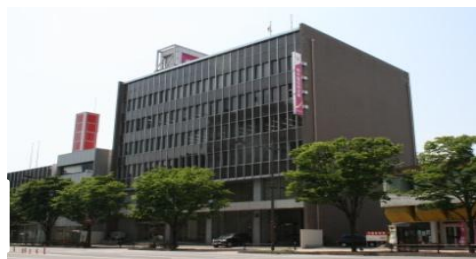
セミナー会場の外観