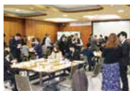
▲創業応援交流セミナー(下関)