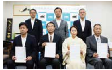
▲下関市地域資源活用促進事業計画認定式

平成30年度は、認定事業者10先に対して、当金庫独自の支援メニュー「にしん地域応援助成金」(助成額:1事業あたり20万円を上限)を交付するとともに、販路拡大の支援として、令和元年5月22日(水)開催の「第12回山口県しんぎん合同ビジネスフェア2019」に「下関市地域資源活用促進事業特別ブース」を設置し、出展支援を実施いたしました。