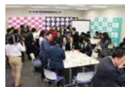
▲創業応援交流セミナー(山口)