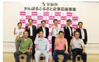
▲宇部市がんばるふるさと企業応援事業支援表明書交付式

平成30年8月10日(金)には、採択事業者に対する補助金交付等を支援するため、宇部市へ寄附金100万円を贈呈するとともに、販路拡大の支援として、令和元年5月22日(水)開催の「第12回山口県しんぎん合同ビジネスフェア2019」に「宇部市がんばるふるさと企業応援事業特別ブース」を設置し、採択事業者6先に対して、出展支援を実施いたしました。