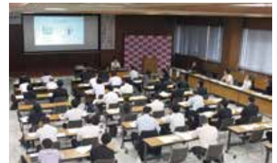
▲IT導入支援補助金申請応援セミナー

セミナーには、合計31社、35名が参加され、外部講師による基調講演、当金庫及び日本政策金融公庫からの情報提供を実施いたしました。また、参加企業の内、4社と具体的なIT補助金申請に向けての個別相談会を実施いたしました。