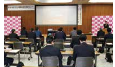
▲ものづくり補助金申請応援セミナー

セミナーには、合計17社、19名が参加され、山口県中小企業診断協会による基調講演、当金庫及び日本政策金融公庫からの情報提供を実施いたしました。