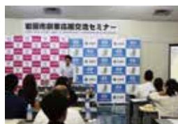
▲創業応援交流セミナー(岩国)

・山口市での開催は、今回が3回目、参加者は累計88名となり、当金庫が創業事業計画策定等の支援を行った結果、4名が創業を行っております。また、創業5年未満の参加者9名に対して、9件の創業関連融資を実行しております。